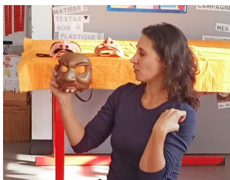
Ecole Primaire de la Maurelette Février 2021 – 13015 Marseille